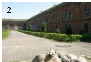
2 – Fort I Centralny