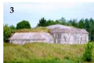
3 – Fort II Zarzeczny