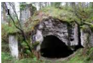
1 – Fort IV Nowy