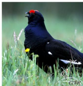
cietrzew - .....