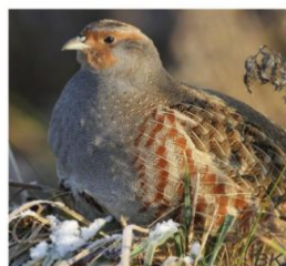
kuropatwa - .....