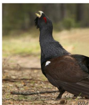
głuszczyk - .....